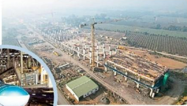
आणंद-नडियाद में निर्माणाधीन स्टेशन। बुलेट ट्रेन के लिए वडोदरा जिले में अंडरस्लंग मैथड़ से वायाडक्ट निर्माण।

अहमदाबाद, गुजरातभर के लोगों के लिए बड़ी खुशखबरी है। अहमदाबाद से वापी के बीच हाई स्पीड रेल (एचएसआर) यानी बुलेट ट्रेन 2027 में दौड़ने की पूरी संभावना जताई जा रही है। लोग चार वर्ष बाद इसमें यात्रा का आनंद ले सकेंगे। वहीं जून 2026 में सूरत-बिलिमोरा के बीच ट्रायल रन शुरू किए जा सकेंगे। देश की पहली बुलेट ट्रेन को