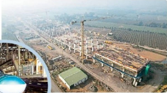
आणंद-नडियाद में निर्माणाधीन स्टेशन। बुलेट ट्रेन के लिए वडोदरा जिले में अंडरस्लंग मैथड से वायाडक्ट निर्माण।